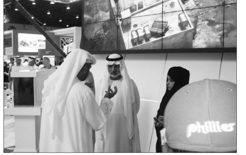
(1000) عارض وبحضور (60) وزيراً للدفاع