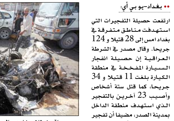
عراقيون يتفقدون احدى السيارات التي انفجرت في بغداد الأمين أدى إلى مقتل احد الأشخاص وإصابة آخرين بجروح، كما أسفر تفجير منطقة السيدية عن مقتل شخص وإصابة 10 آخرين، مضيفاً أن حصيلة انفجار منطقة الكرادة بلغت مقتل ثلاثة أشخاص وإصابة 19 آخرين. وكان مصدر في الشرطة العراقية قال في وقت سابق امس إن أربعة تفجيرات بسيارات

بغداد-يو بي أي: ارتفعت حصيلة التفجيرات التي استهدفت مناطق متفرقة في بغداد امس إلى 28 قتيلًا و 124 جرحيا. وقال مصدر في الشرطة العراقية إن حصيلة انفجار السيارة المفخخة في منطقة الكيارة بلغت 11 قتيلًا و 34 جرحيا، كما قتل ستة أشخاص وأصيب 23 آخرين بالتفجير الذي استهدف منطقة الداخل بمدينة الصدر، مضيفاً أن تفجير منطقة الكمايلية أسفر عن مقتل شخص وإصابة أربعة آخرين. وأكدت المصادر الأمنية انفجار 10 سيارات مفخخة في بغداد هذا الصباح. وأضافت المصادر أن حصيلة تفجير منطقة الحسينية بلغت خمسة قتلى 17 جرحيا، كما أصيب ثمانية أشخاص بينهم ثلاثة من عناصر الشرطة. وقال المصدر أن تفجير منطقة