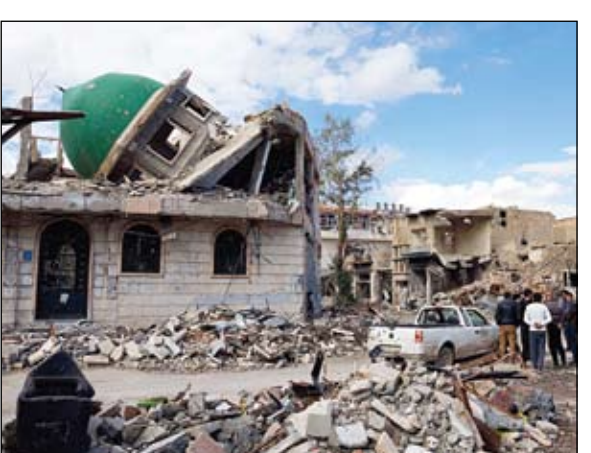
توار يعاينون مسجدا هدم في قصف للنظام بدير الزور في غضون ذلك، قال الجيش السوري الحر إنه سيطر على المركز الطبي الذي يعد تجمعا لقوات النظام في عدرا بريف دمشق. وأفاد مصدر بأن 650 عسكريا بينهم خمسون ضابطا انشقوا في ريف دمشق بتأمين من لواء الإسلام وكتيبة حديثة بن اليمان. ونقل المصدر عن ضابط منشق برتية عميد قوله إن الكثير من العسكريين ينتظرون اللحظة

بعد محادثات في مقر جامعة الدول العربية قال الابراهيمى ان المفاوضات قد تبدأ في مقر الامم المتحدة. ولم يذكر مكانا محددا. وكان زعيم الائتلاف الوطني السوري المعارض معاذ الخطيب عرض الاسبوع الماضى اجراء محادثات مع فاروق الشرع نائب الرئيس السوري بشار الاسد حول عملية انتقال سياسي يحظى فيه الاسد بخروج امن الى المنفى. وقال الابراهيمى مبادرة الخطيب فحلت الباب وتحدثت الحكومة السورية فيما تقوله بأنها تريد حلا سلميا ولو بدأ الحوار في أحد مقرات الامم المتحدة في البداية على الاقل بين المعارضة ووفد من الحكومة السورية فيشكل ذلك بداية للخروج من النفق الظلم الذي دخلته سوريا. وأضاف هذه المبادرة لا تزال مطروحة وستبقى مطروحة ويجب على الاطراف المختلفة أولا في سوريا وثانيا في المنطقة وعلى المستوى الدولي أن تتعامل مع هذه المبادرة من أجل نجاحها. ولم يتضح بعد ما اذا كان الابراهيمى تلقى أي مؤشر من