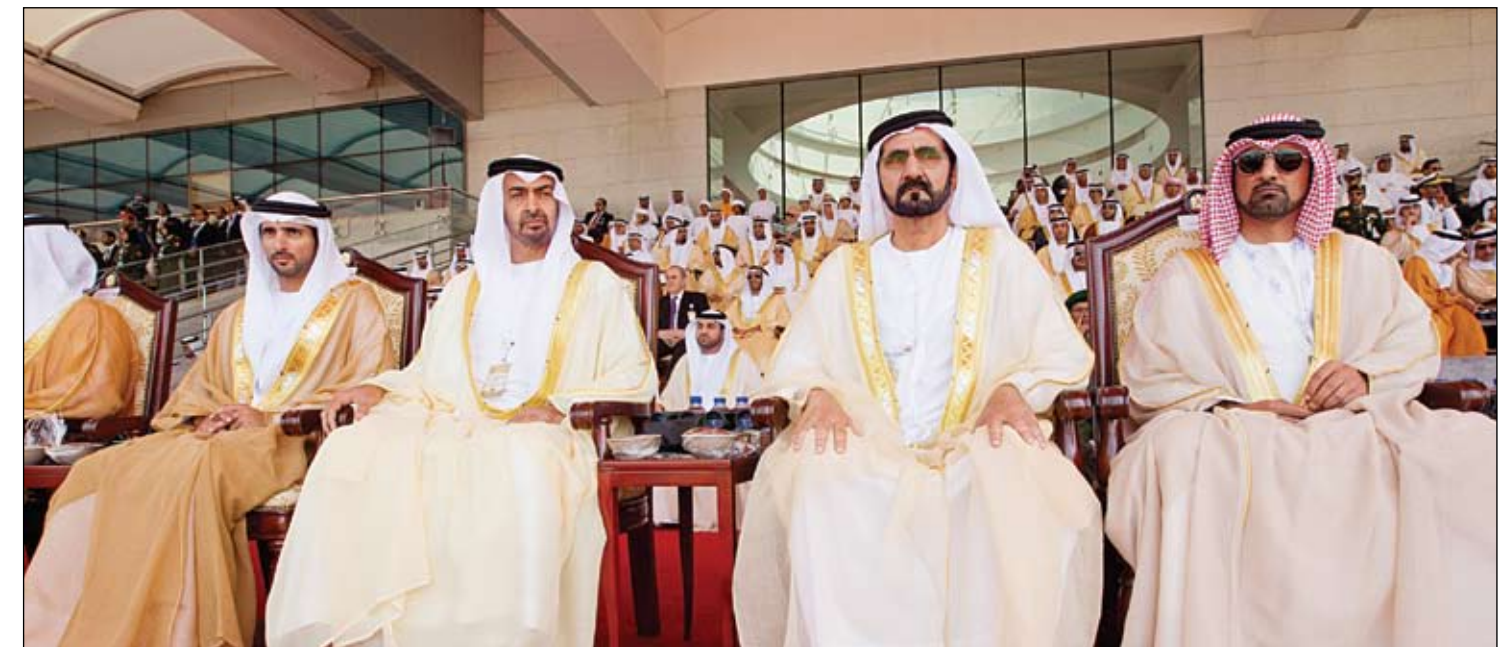
محمد بن راشد ومحمد بن زايد وأولياء العهود يشهدون افتتاح معرض ومؤتمر الدفاع الدولي أيدكس 2013 (وام) محمد بن راشد ومحمد بن زايد وأولياء العهود يشهدون افتتاح معرض ومؤتمر الدفاع الدولي أيدكس 2013 (وام) حاكم الشارقة وسمو الشيخ عمار بن حميد النعيمي ولي عهد عجمان. سمو الشيخ حمدان بن محمد بن راشد آل مكتوم ولي عهد دبي و سمو الشيخ عبدالله بن سالم بن سلطان القاسمي نائب الرئيس أمام المنصة الرئيسية التي اكتظت بالحضور من دولة الإمارات والدول العربية والصديقة. حضر الافتتاح..

أبو ظبي-وام: شهد صاحب السمو الشيخ محمد بن راشد آل مكتوم نائب رئيس الدولة رئيس مجلس الوزراء حاكم دبي رعاه الله وإلى جانبه الفريق أول سمو الشيخ محمد بن زايد آل نهيان ولي عهد أبوظبي نائب القائد الأعلى للقوات المسلحة امس.. وقائع الحفل الرسمي لعرض ومؤتمر الدفاع الدولي أيدكس 2013 ومعرض الدفاع البحري نافدكس حيث بدأ الحفل بالسلام الوطني لدولة الإمارات. وقدمت فرقة فيجي العسكرية للمحاربين القدامى عرضاً أمام المنصة الرئيسية بعنوان رقصة رماح الحرب و رقصة المروحة ثم قدمت فرقة التايكو العسكرية اليابانية لوحة أمام صاحب السمو الشيخ محمد بن راشد آل مكتوم والحضور بعنوان بث الربيع في قلوب الأعداء.. ثم شهد سموه العرض الرئيسي للإفتتاح الرسمي الذي تمثل في سيناريو